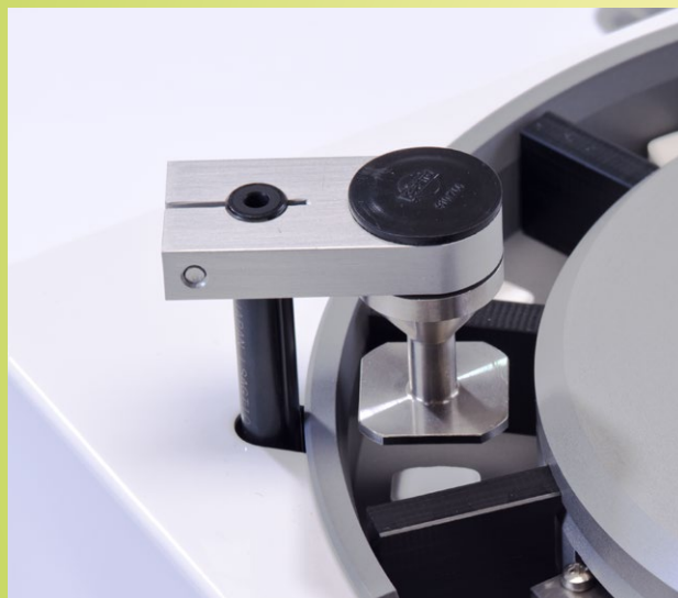
Optionale Messung der Tablettendicke mit Hilfe eines motorbetriebenen linearen Potentiometers*.